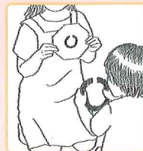
3歳児健診にて視力検査をします

生後3か月～6か月ぐらいまでに急激に発達し、8歳くらいまで緩やかに発達していきます。成長する過程で何らかの問題が生じ正常に発達できないと、見る機能に影響を及ぼす可能性があります。問題を残したままにして視覚感受性期を過ぎてしまうと、年齢が大きくなってから治療を始めても手遅れになってしまうことがあります。